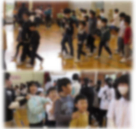
ようこそ1年生集会の様子

児童会では、今年度の児童会スローガン【全校で交流を大切にし、笑顔で過ごせる楽しい東小】の実現に向けて、活動が始まり、「ようこそ1年生集会」では、金管バンドの演奏で1年生を温かい雰囲気迎え、正にスローガンのように学年関係なく笑顔でクイズやじゃんけん列車を楽しむ姿であったと思います。