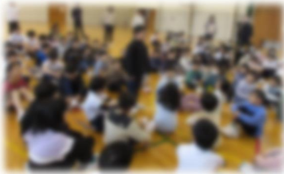
対話による生活オリエンテーション