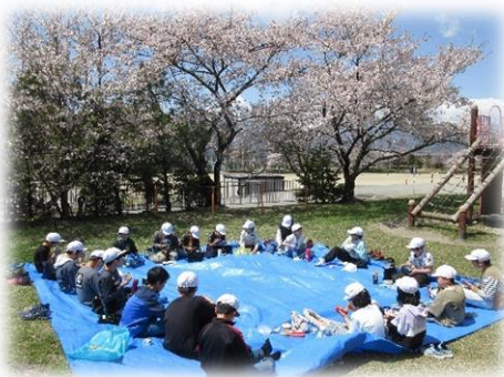
4年お花見弁当の様子