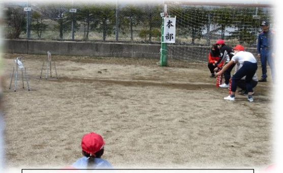
避難訓練～消火器の使い方の学習～