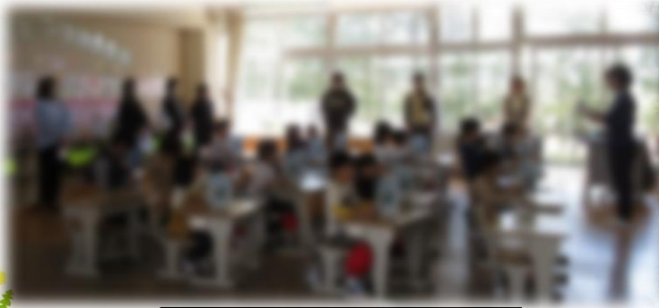
授業参観～1年生の様子～